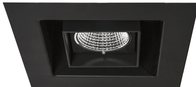
Svart / Black

Cube DS Food Fresh LED är en specialutgåva av LED-spotlighten Cube DS LED , för belysning av "frukt & grönt", chark-, bröd- och blomavdelningar etc.