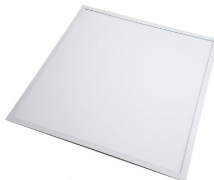
Vit / White